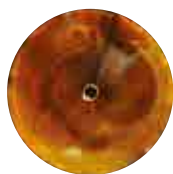
Andere Hydrauliköle Nach 1.000 Betriebsstunden