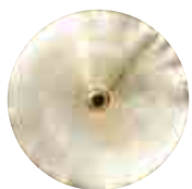
Mobil DTE 20 Ultra Nach 1.000 Betriebsstunden