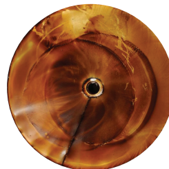
Mineralisches Hydrauliköl nach ISO VG 46 nach 1.000 Stunden (Ablagerungen begannen nach 500 Stunden)