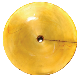
Mobil SHC Cibus™ 46 nach 1.250 Stunden

Die Hochleistungsschmierstoffe der Mobil SHC Cibus™ Reihe sind verglichen mit Standard-Umlaufölen langlebiger und halten Ihre wertvollen Anlagen länger sauber. Tests auf unserem MHFD-Prüfstand (Mobil Hydraulic Fluid Durability) belegen, dass es im Vergleich zu Mineralölen gleicher ISO VG (46) zu deutlich weniger Ablagerungen kommt.